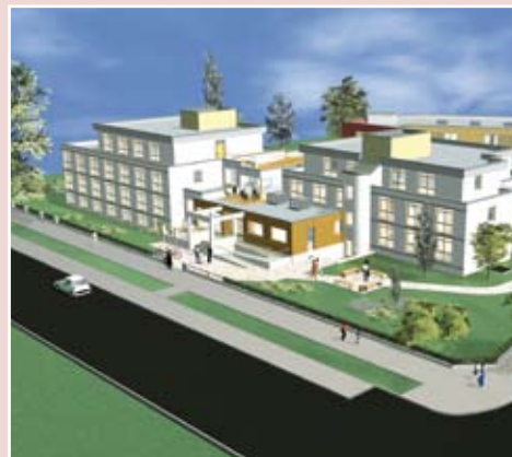
Architektur-Modell – Straßenseite

» Bewohner und ihre Angehörigen legen großen Wert auf edles Ambiente.