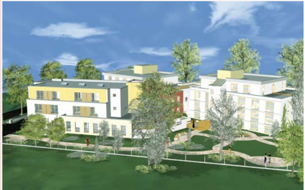
Architektur-Modell des Neubaus der Residenz Dahlem – Gartenseite