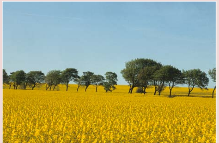
Rapsfeld im Mai