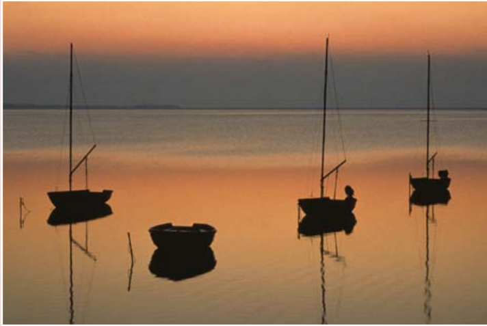
Segelboote vor Ummanz