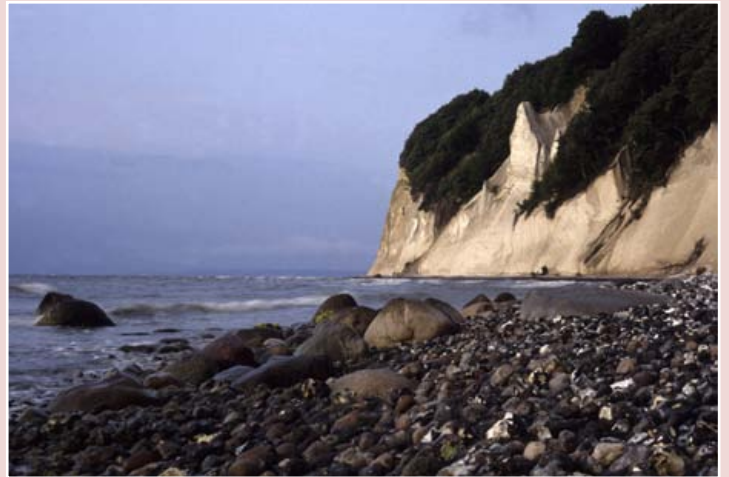
Wissower Klinken von unten