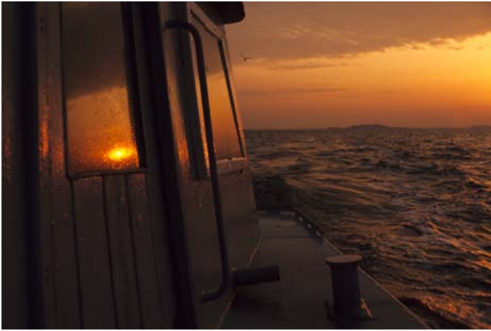
Sonnenaufgang vor Mönchsgut