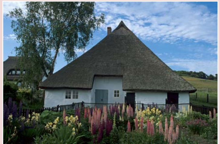
Pfarrwitwenhäuschen auf Mönchsgut