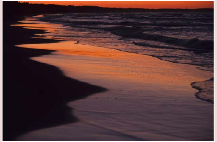
Sonnenuntergang bei Binz