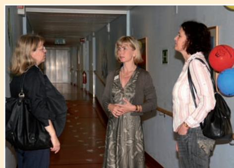
Sonntagsführungen – Ausführliche Beratungsgespräche und Haus-Rundgang

Jeden ersten Sonntag im Monat finden Hausführungen statt, bei denen Interessenten durch verschiedene Wohnbereiche geführt werden. Über die Hälfte der Besucher meldet sich vorher telefonisch an, man kann jedoch auch ohne Termin vorbeikommen. Dabei sollte man sowohl hier als auch in einem anderen Pflegeheim einige Punkte beachten, die später die Entscheidung erleichtern. Sind die Bewohner zufrieden mit ihrer Pflegeeinrichtung, den Beschäftigungsangeboten und der Betreuung durch die Pflegekräfte? Gehen die Mitarbeiter freundlich mit den Senioren und auch mit den Besuchern um? Fühlt man sich ausreichend informiert?