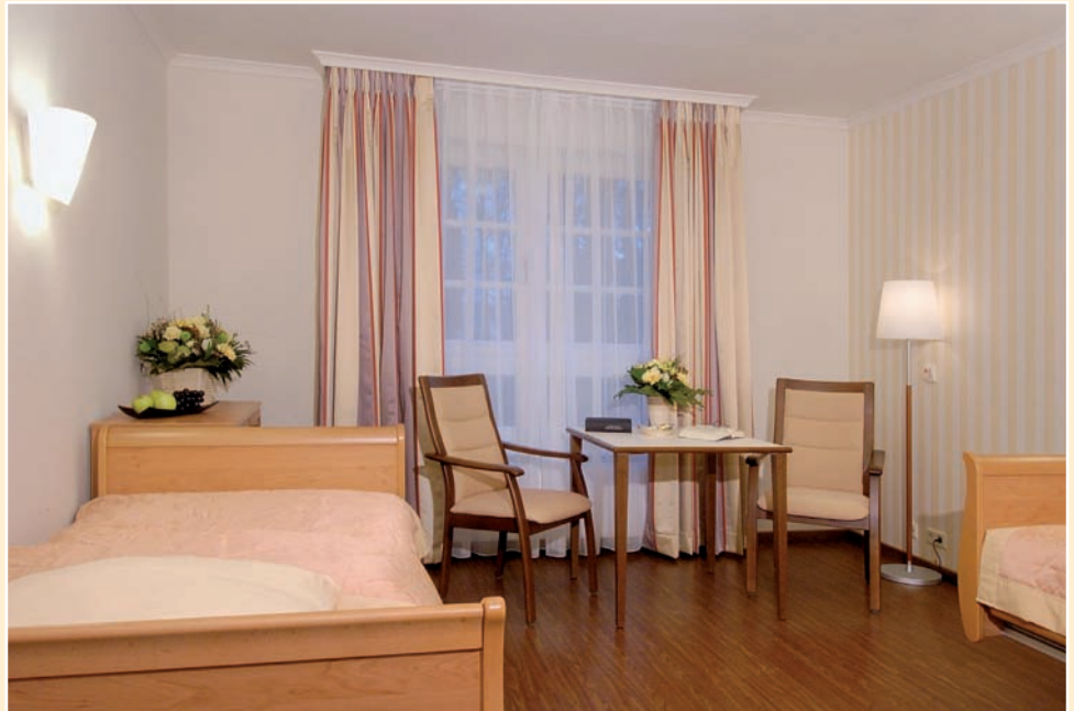
Immer hilfreich bei Auswahl eines Pflegeheims ist der individuelle Eindruck vor Ort